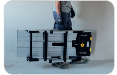
Compact ! Transport facile