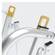
Anneaux de grutage de série