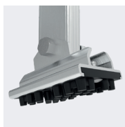
Patins pivotants antidérapants pour s'adapter à toutes les situations