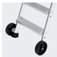
Roues pour faciliter le déplacement